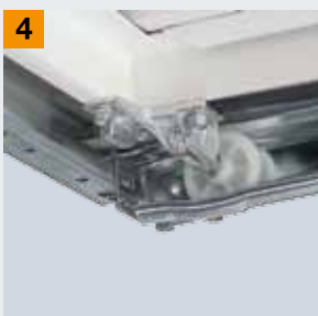
Žleb za postavljanje točkića