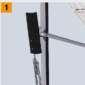
Zaštita od prignječenja prstiju

U udubljenju na vodiči vrata se bezbedno zaustavljaju do mirovanja.