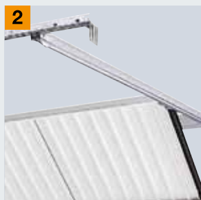
Šina kojom se kreće na plafonu